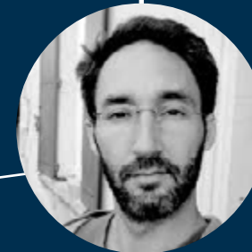
Sébastien Davis : Mise en scène et vidéo